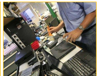
Une intervention d'Actif Azur dans les locaux d'Inria

La proposition d'Actif Azur s'est avérée être plus pertinente selon la grille d'analyse privilégiant le taux horaire pratiqué.