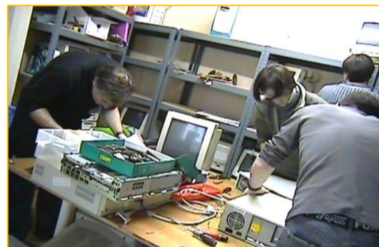
Chantier d'insertion Infosel